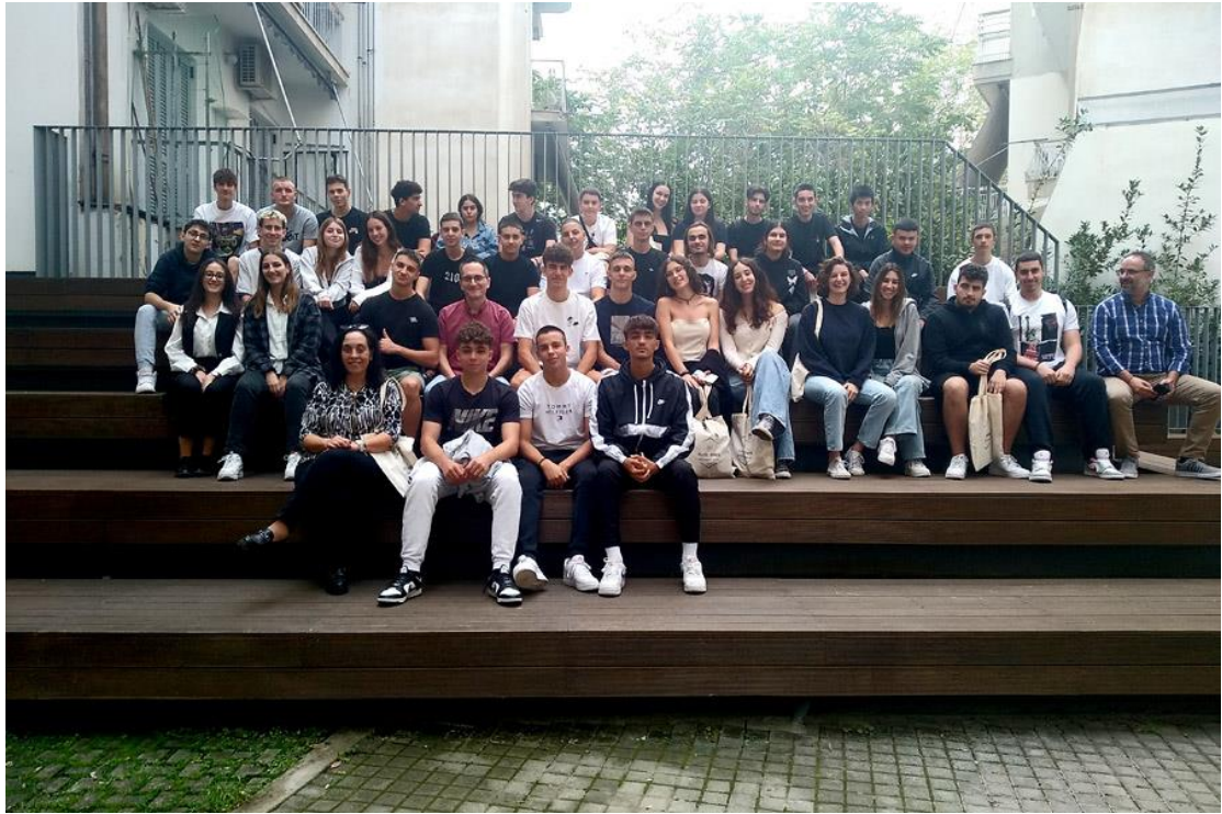
9/11/2023: Λύκειο-Εκπαιδευτήριο «Ο ΠΛΑΤΩΝ»