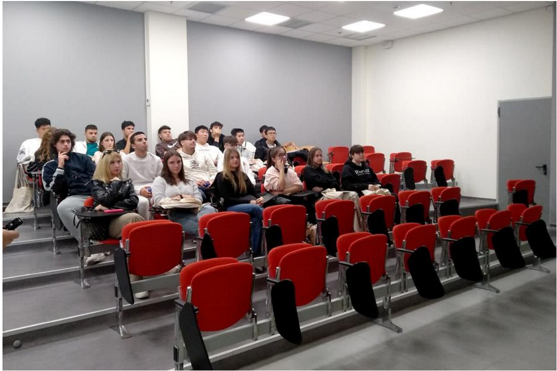
22/11/2023: Λύκειο - Εκπαιδευτήριο «ΛΑΜΠΙΡΗ»