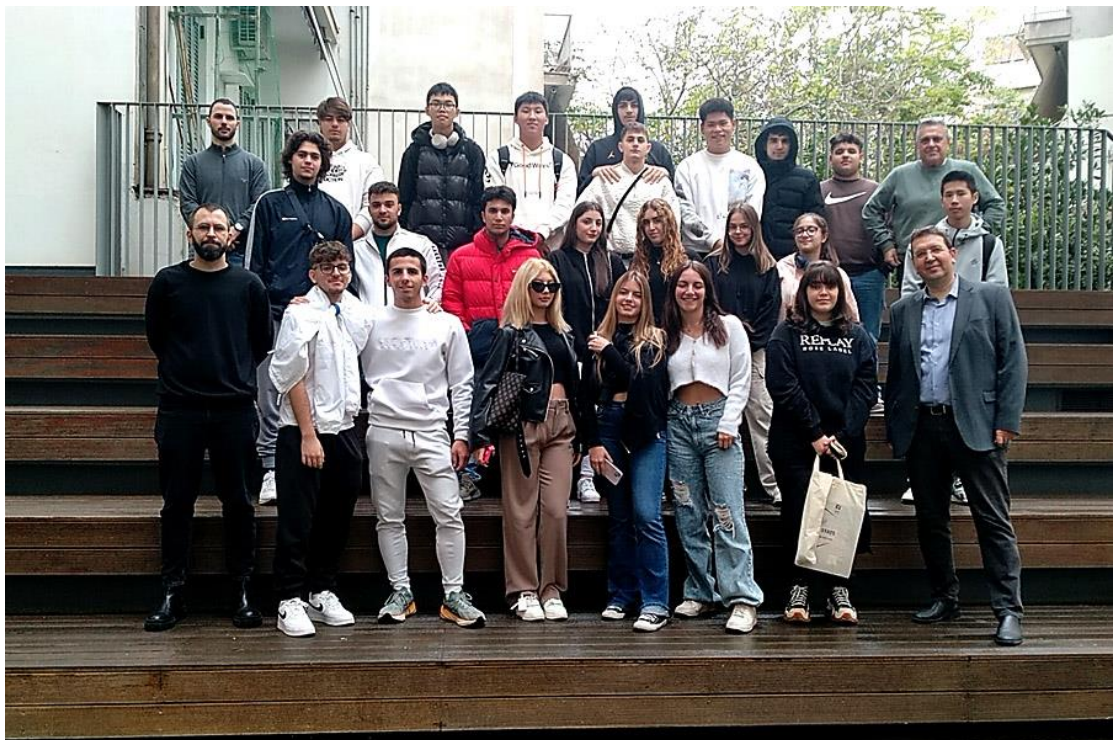
22/11/2023: Μαθητές και καθηγητές από το Λύκειο-Εκπαιδευτήριο «ΛΑΜΠΙΡΗ»