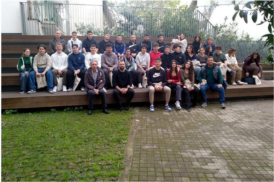
23/11/2023: 3 ο ΓΕΛ ΔΑΦΝΗΣ