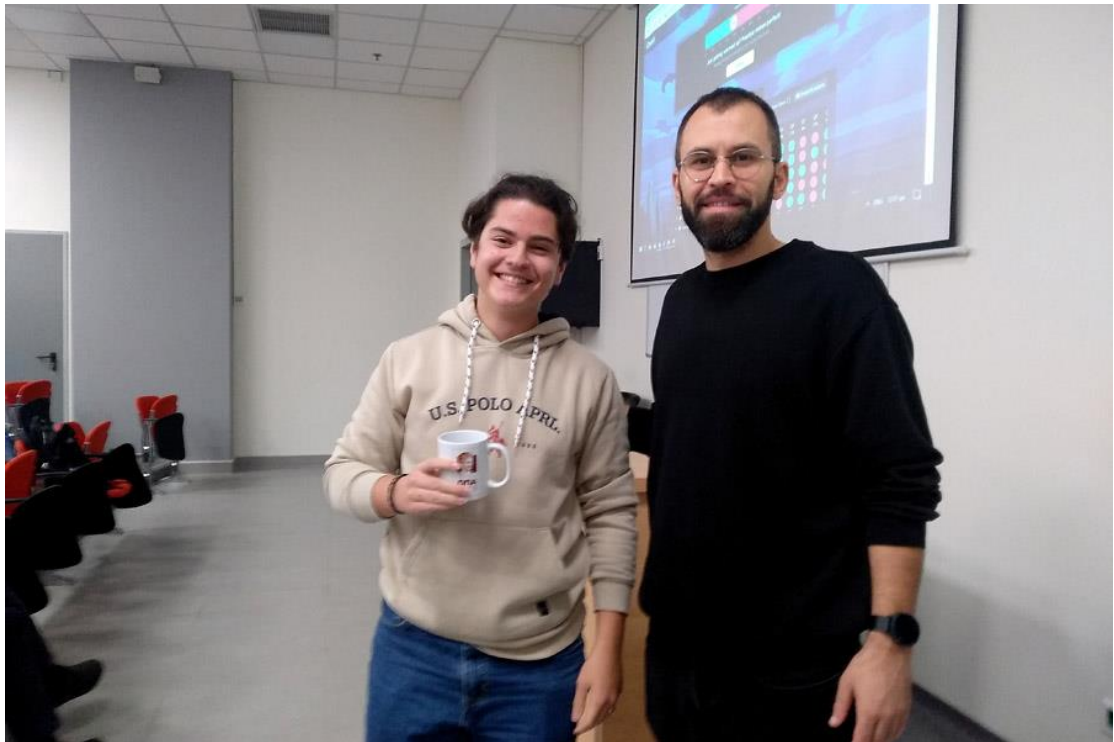
23/11/2023: Ο διδάσκων-ομιλητής κ. Β. Χασιώτης με μαθητή-νικητή του διαγωνισμού