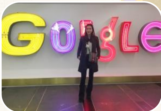
Για 5 η συνεχή χρονιά φοιτητές ΔΕΤ στο Educational Trip (ΗΠΑ)