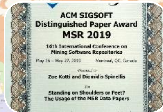
Διάκριση ACM SIGSOFT Distinguished Paper Award στο συνέδριο MSR' 19: 16th International Conference on Mining Software Repositories (Καναδάς)