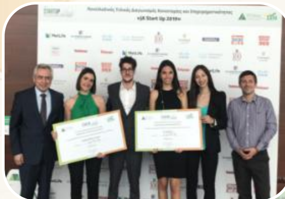
Βραβείο Καινοτομίας και τη 2 η θέση στον 5 ο Πανελλαδικό Φοιτητικό Διαγωνισμό Καινοτομίας και Επιχειρηματικότητας JA Start Up 2019 (Ελλάδα)