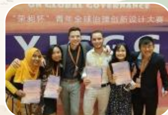
1 η θέση στον ετήσιο διαγωνισμό Παγκόσμιας Διακυβέρνησης Youth Innovation Competition on Global Governance (Ινδονησία)