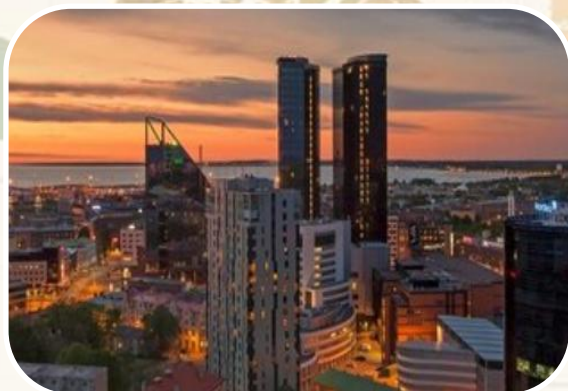
Βράβευση εργασίας στο διεθνές διαγωνισμό Student Research Competition (Εσθονία)