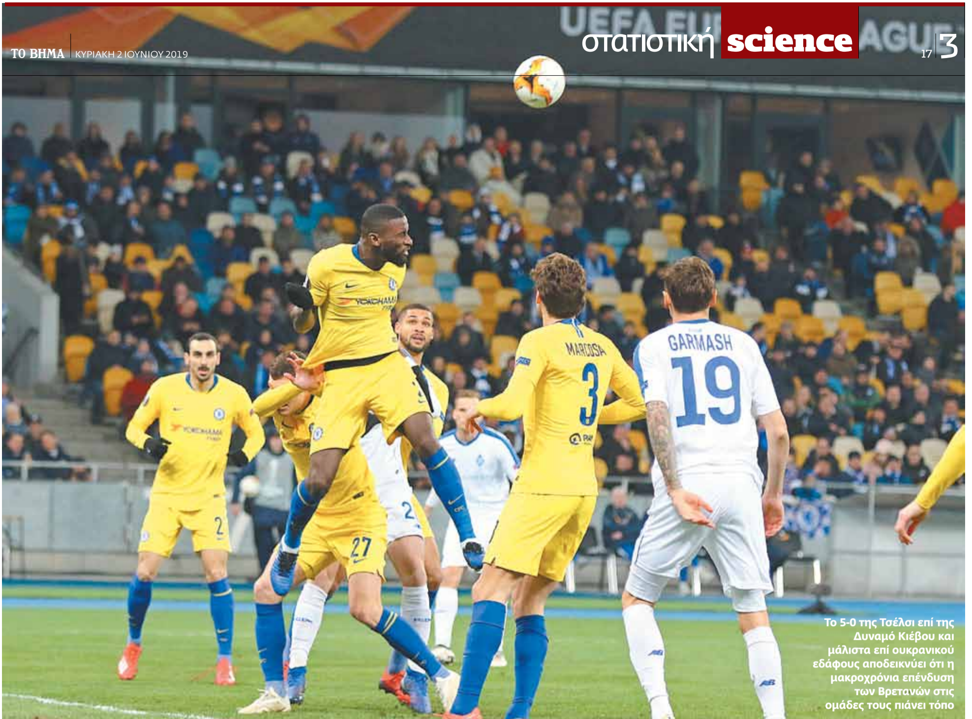
Το 5-0 της Τσέλσι επί της Δυναμό Κιέβου και μάλιστα επί ουκρανικού εδάφους αποδεικνύει ότι η μακροχρόνια επένδυση των Βρετανών στις ομάδες τους πιάνει τόπο